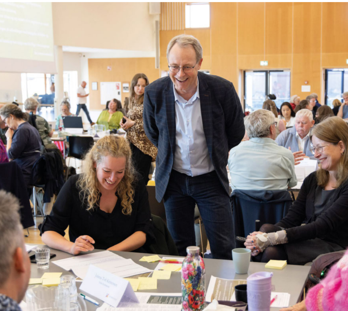
Det Centrale Handicapråds temadag om fritids- og foreningsfællesskaber.